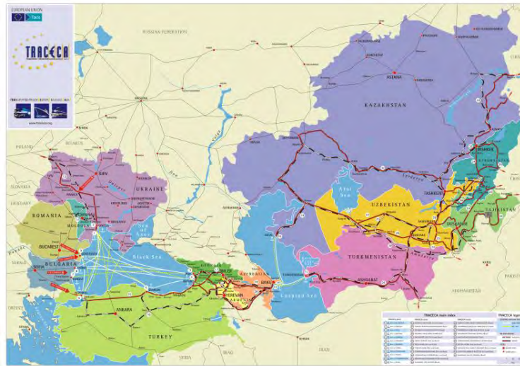
شکل 6: کریدور تجاری تراسیکا

توسعه زیر ساخت های حمل و نقل زمینی آسیا ۵ که شامل سه کریدور تجاری شرق - غرب، شمال - جنوب و مرکزی آسیا با طول بیش از چهار هزار کیلومتر می باشد. پروژه توسعه زیرساخت حمل و نقل زمینی آسیا برای اولین بار در چهل و هشتمین اجلاس کمیسیون اقتصادی و اجتماعی آسیا و اقیانوسیه (سال 1992) مطرح شد. این پروژه یک چارچوبی را برای هماهنگ سازی یک شبکه حمل و نقل منطقه ای با تمرکز به سه عامل شبکه بزرگراه های آسیایی، شبکه راه آهن آسیایی و نهایتاً تسهیل حمل و نقل زمینی تهیه می کند. اعضای فعلی این کریدور عبارتند از افغانستان، ارمنستان، آذربایجان، بنگلادش، کامبوج، چین، هند، اندونزی، ایران، قزاقستان، قرقیزستان، لائوس، مالزی، مغولستان، میانمار، نپال، پاکستان، فیلیپین، کره، روسیه، سنگاپور، سریلانکا، تاجیکستان، تایلند، ترکمنستان، ترکیه، ازبکستان و ویتنام.