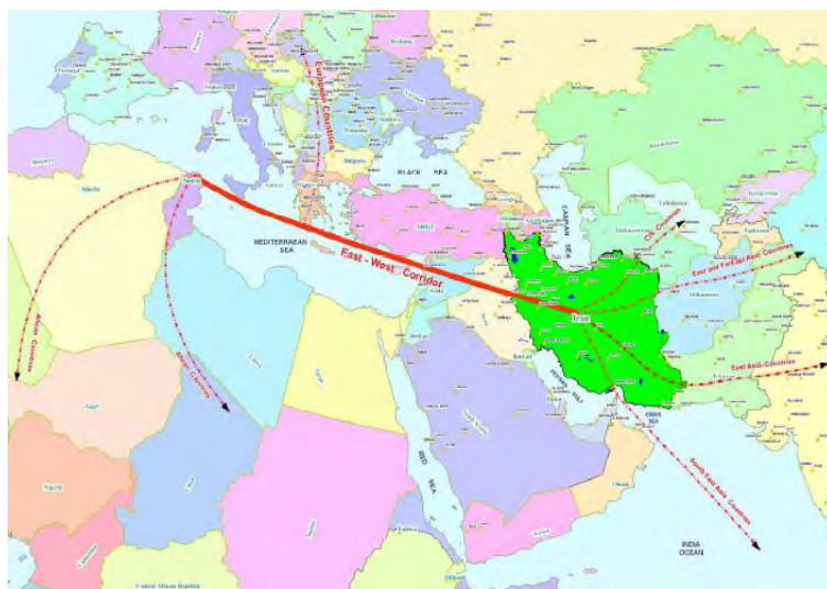
شکل 3: کریدور تجاری شرق - غرب