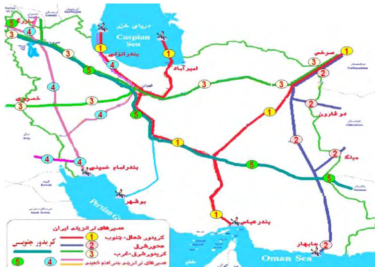
شکل 8: نقشه آرمانی کریدورهای ساخته شده و در دست ساخت در ایران