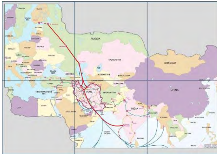
شکل 2: کریدور تجاری شمال - جنوب