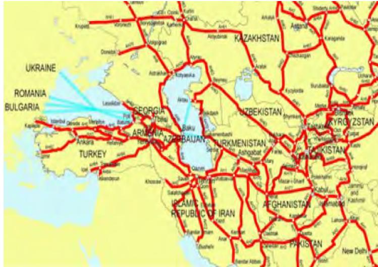
شکل 5: شبکه بزرگراه های آسیا