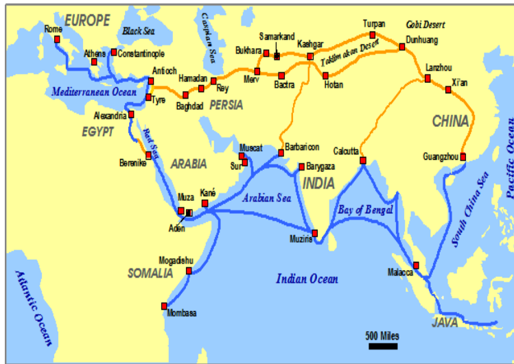
شکل 4: کریدور باستانی ابریشم